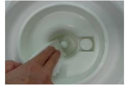
ボトル差込口を掃除

ボトル差込口（特に底の部分）をウェットワイパーで拭き取ります。 ※ボトル差込口中央の突起部には手を触れないでください。